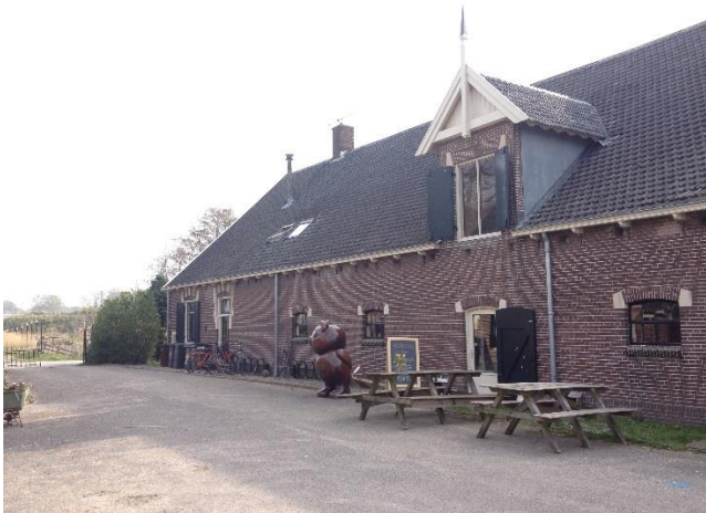
De Vrijstaat Boerderij (kantoor & werkplaats)

Voor de snelste verbinding kijk je op www.9292.nl . Er stoppen 3 bussen vanaf Utrecht Centraal vlak bij het terrein van De Vrijstaat: lijn 19, 28 en 39 (halte Centrum Boulevard). Vanaf de bushalte zie je de boerderij liggen. Bij het gele muurtje ga je het trapje af (dat nog niet helemaal is afgebouwd) naar ons erf.