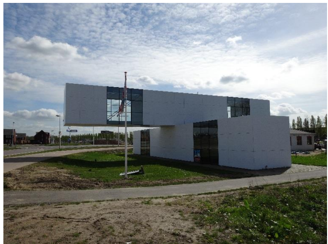
Het Gebouw – de expositieruimte van De Vrijstaat